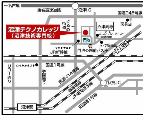
「入校説明・選考会場」案内図